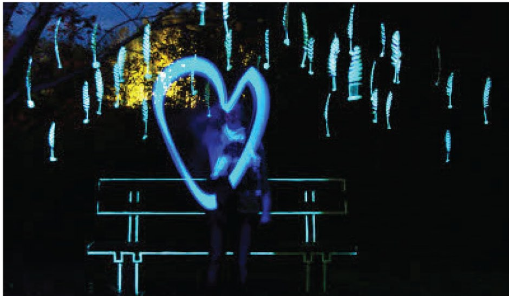
Das Licht in Bilder einfangen – das war das Ziel des Fotoworkshops, der parallel zur Lichtklangnacht mit Foto-Designerin Silke Paustian stattfand. Zehn NNN-Leser nahmen daran teil und konnten trotz guter Vorkenntnisse noch viel lernen. Die besten Bilder, ausgewählt von der Fotografin, sind auf dieser Seite zu sehen. Dieses Bild von Jens Gröbe ist gegenüber des chinesischen Gartens an einer Lichtinstallation entstanden. Eine Besucherin schwingt ein Knicklicht in Herzform für die Kamera.