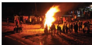
Magische Atmosphäre: Klaus Möller holt die Magie des Feuers ins Bild.