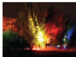
Wie Licht herbstliche Stimmung zaubert, wird von Rüdiger Lietz festgehalten.