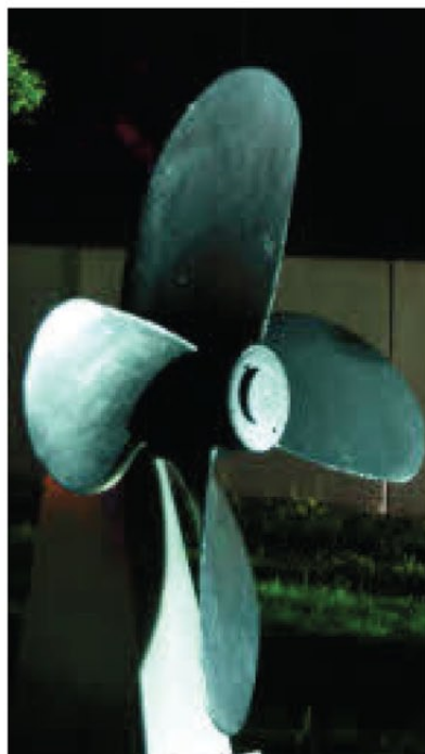
Kälte der Schiffsschraube betont: Jens Gröbe spielt mit Licht und Schatten.