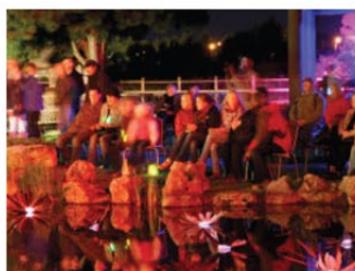
Impressionen werden von Barbara Thielk aus dem chinesischen Garten festgehalten.