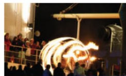
Feuerkugeln aus geschwungenen Fackeln hat Rüdiger Lietz im Bild gefangen.