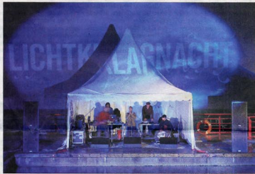
Zutaten des Events: Musik, Tanz, Literatur und Licht

Die Lichtklangnacht ist am 12. und 13. September von 20 bis 24 Uhr an fünf Stationen statt, Kinder bis 14 Jahren haben freien Eintritt.