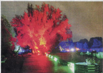
Bunt und verzaubert: Der IGA-Park im Farbenmeer