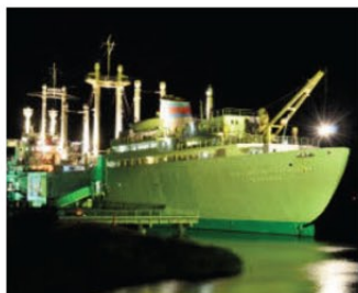
Traditionsschiff bei Nacht: Dorothee Köhn lässt es in Grün erstrahlen.