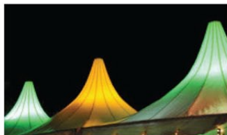
Effektvoll setzt Yvonne Wernitzsch die Parkbühne in Szene.

LICHTKLANGNACHT Zehn NNN-Leser nahmen an einem besonderen Foto-Workshop teil. Das sind die schönsten Fotos.