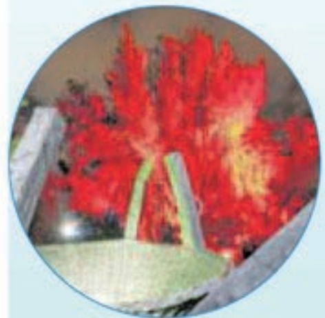
Lichtspiele in der Baumkrone.