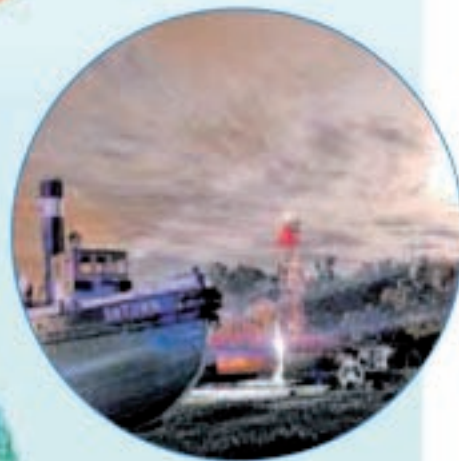
Auch Schiffe werden beleuchtet.