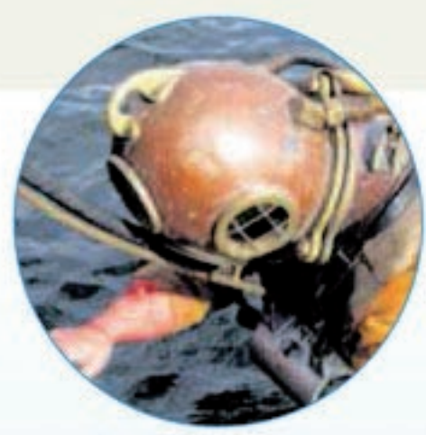
Ein Helmtaucher steigt ins Wasser.